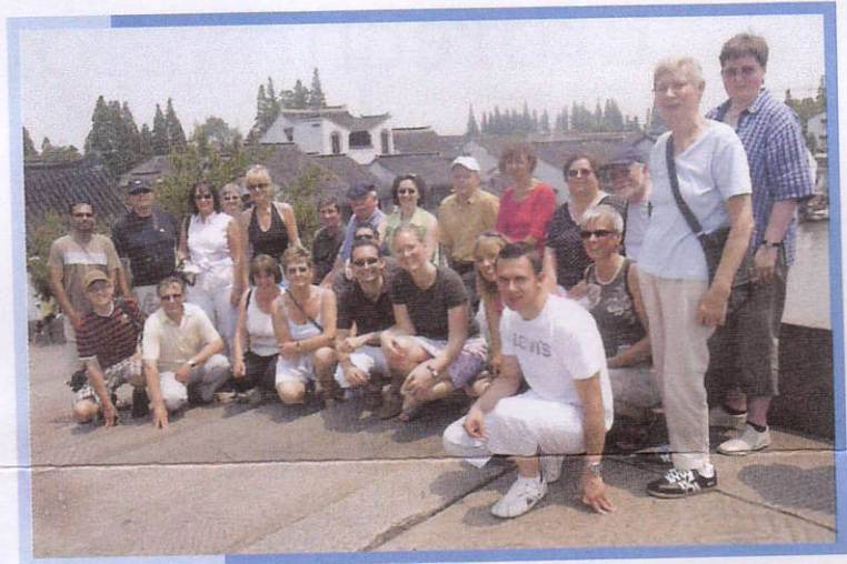
▲ 24 begeisterte Teilnehmerinnen und Teilnehmer

An uns ziehen daher dem Abriss geweihte Geisterstädte, neu gebaute Städte, Spundwände und viele Baustellen vorbei. Die Landschaft in den drei Schluchten ist atemberaubend schön: Die Felsen ragen links und rechts bis zu 1.200 m hoch, bizarre Felsvorsprünge und subtropischer Urwald wechseln sich ab. Die Talsperre in der dritten Schlucht ist 2,8 km lang, dazu kommt je eine sechsstufige Schleuse flussauf- und flussabwärts. Kritik am Projekt wird von offizieller Seite verschwiegen, überall werden die positiven Seiten der Aufstauung betont: Energiegewinnung, Überschwemmungsschutz und bessere Infrastruktur.