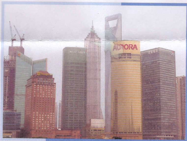
▲ Hochhausbauten im Shanghaier Finanzdistrikt: Der "Flaschenöffner" ist das neue, 492 m hohe Finanzzentrum